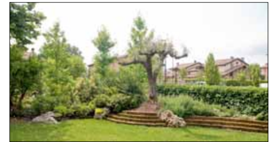
Progettazione e manutenzione area cortiliva in villa singola