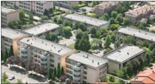
Complesso edilizio quartiere PEEP Arceto (RE)