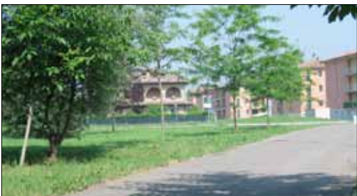
Verde pubblico quartiere PEEP