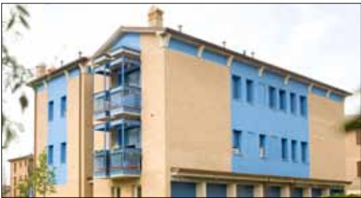
Palazzina sei alloggi quartiere PEEP Manca Località