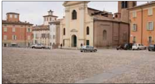
Pavimentazione Piazza Boiardo a Scandiano (RE)