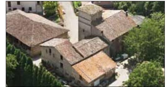
Ristrutturazione borgo storico con casa a torre Manca Località