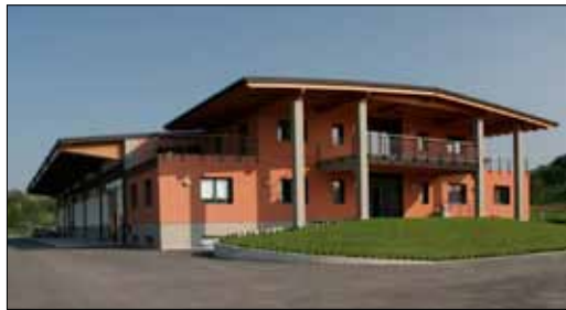
Cantina Bertolani a Scandiano (RE)